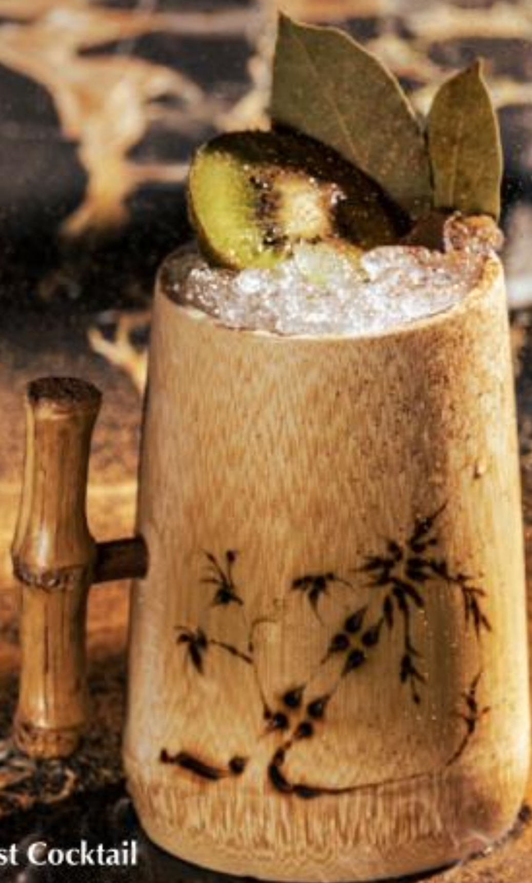
For-rest Cocktail フォレスト・カクテル

オーロラバーのオリジナルカクテルとともに、真夏の昼、夜、そして夏の海を巡る旅に出かけましょう。