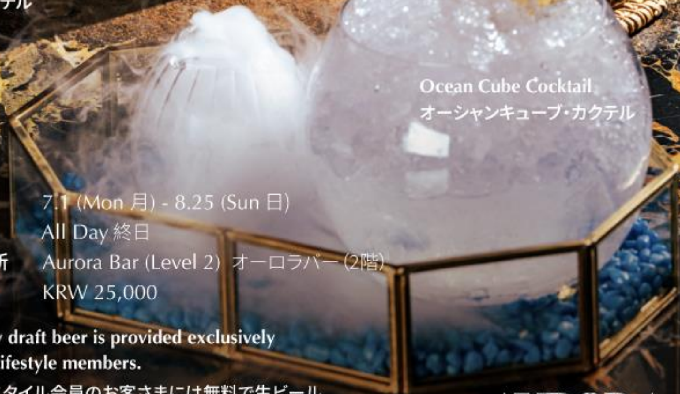
Ocean Cube Cocktail オーシャンキューブ・カクテル