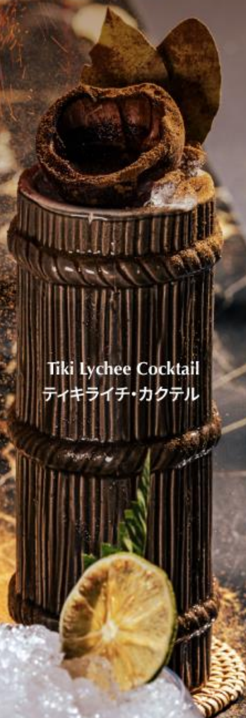
Tiki Lychee Cocktail ティキライチ・カクテル